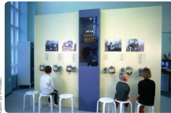
Radio- ja tv-museo

Radio- ja tv-museo Lahdessa tarjoaa mielenkiintoisia kokemuksia kaiken ikäisille koululaisille. Pysyvä Kidekoneesta data-aikaan -näyttely esittelee alan historiaa kidekoneesta, putkiradiosta ja gramofonista nykypäivän digilähetyksiin. Vaihtuvat erikoisnäyttelyt täydentävät laajaa pysyvää näyttelyä.